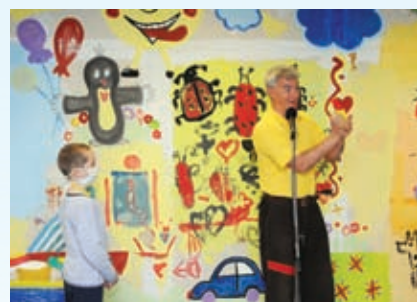
Začátek školního roku ve FN Motol