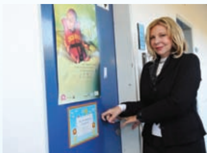
Tisková konference Banky pupečnickové krve se společností Shell Czech republik, a.s.